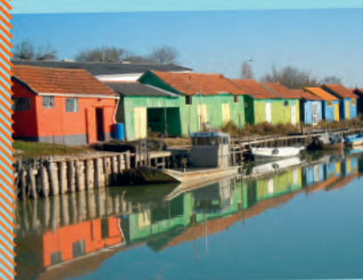
Cabanes ostréicoles du Château d'Oléron