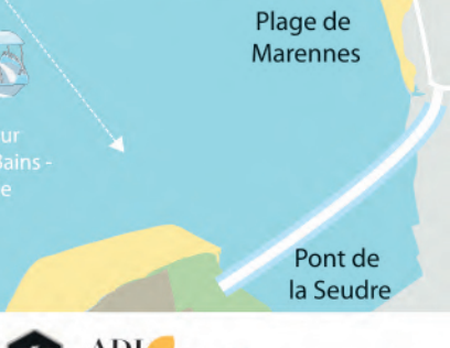
Plage de Marennes