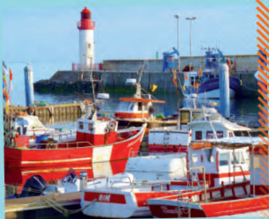
Le Port de la Cotinière