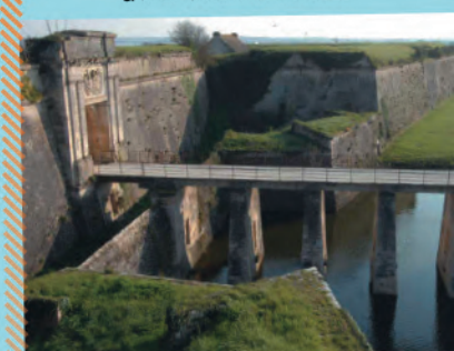
La citadelle du Château d'Oléro