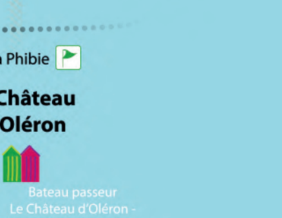
Bateau passeur Le Château d'Oléron - Bourcefranc-le-Chapus