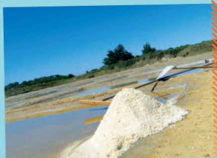
Le Port des Salines